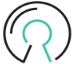
Open Source Software