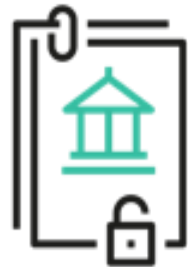
Open Government Data